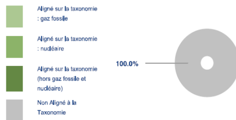
Ce graphique représente 100% du total des investissements.

* Aux fins de ces graphiques, les «obligations souveraines» comprennent toutes les expositions souveraines.