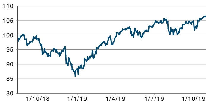
Actio Rendement 2018